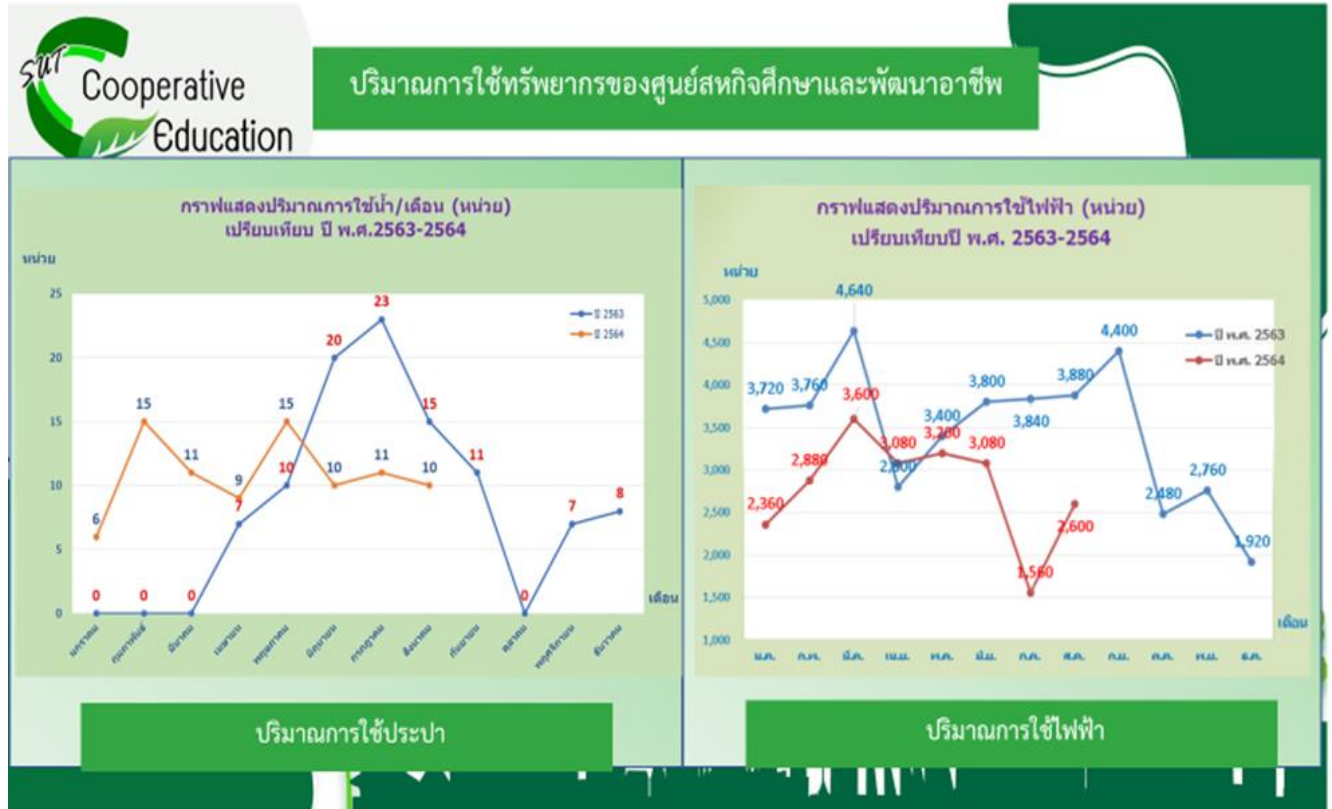
ปริมาณการใช้ประปา