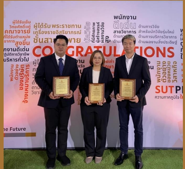
เรียบเรียงภาพและข่าวโดย : ฝ่ายพัฒนาอาชีพ

ศิษย์เก่าสหกิจศึกษาดีเด่น สาขาวิชาเทคโนโลยีอาหาร สำนักวิชาเทคโนโลยีการเกษตร