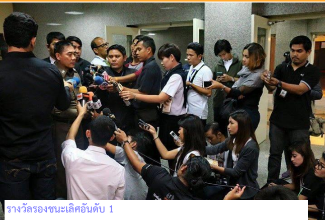
รางวัลรองชนะเลิศอันดับ 1